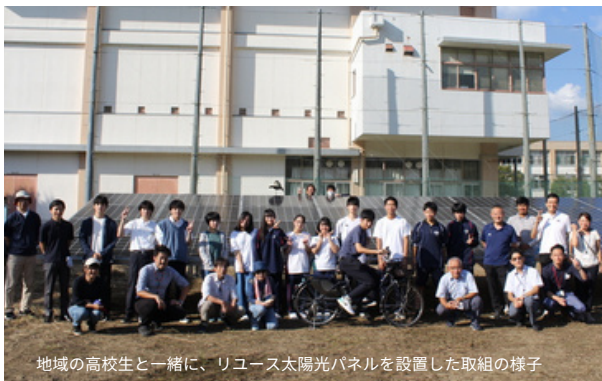
地域の高校生と一緒に、リユース太陽光パネルを設置した取組の様子